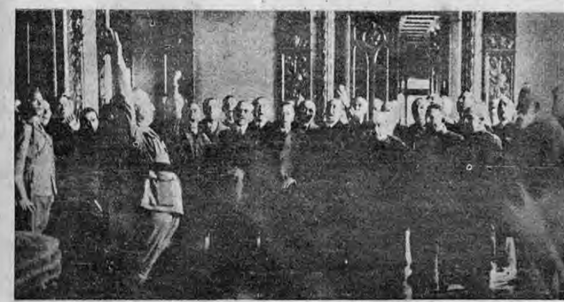
Los miembros de la junta de Burgos... Figuras entre los presentes: Monseñor Manuel de Castro, Arzobispo de Burgos, y los generales Cabanellas y Saliquet.

ALISTA MEXICO UN NUEVO CARGAMENTO DE ARMAS PARA EL GOBIERNO DE MADRID LOS DOS VAPORES DESTINADOS AL TRANSPORTE DE ESAS ARMAS, EL "CRISOBAL COLON" Y EL "MANUEL ARNUS", SE ENCUENTRAN, EL PRIMERO ENCALLADO EN BERMUDEZ, Y EL OTRO DETENIDO EN LA HABANA