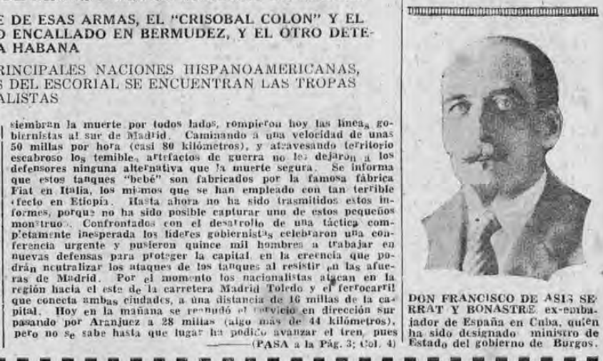
DON FRANCISCO DE ASÍS DE RRRAT Y BONASTRE, ex-embajador de España en Cuba, quién ha sido designado ministro de Estado del gobierno de Burgos.

MADRID, 26.—Tanques "dinamitetas" que corren a través de la campaña con una velocidad increíble y cuyas ametralladoras