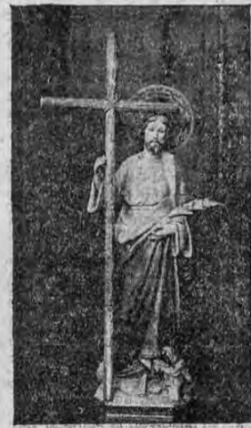
SAN JUDAS TADEO

Con gran solemnidad se celebra mañana la festividad de San Judas Tadeo. A las 8 de la mañana todos sus devotos se congregarán en la iglesia de Nuestra Señora del Carmen, donde será recada una misa en su honor.